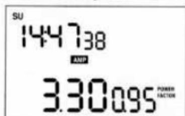
FIGURE 5 Affichage de l'intensité du courant