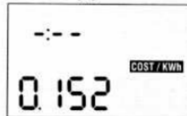
FIGURE 3 Programmation du tarif local